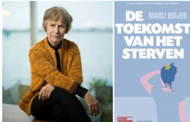
De toekomst van het sterven

een bijeenkomst met een presentatie door de filosoof en voormalig arts Marli Huijer over haar laatste boek: